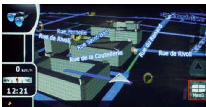
Unverkennbar: Die bewährte iGo-Software