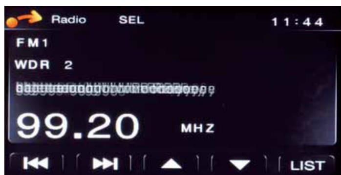
Zenec bietet komplette iPod/iPhone-Unterstützung