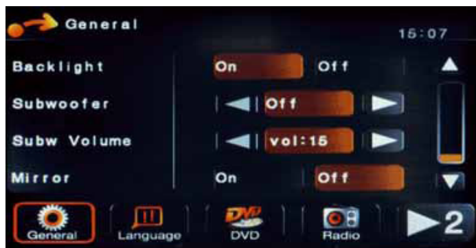
Der Subwoofer kann über die Headunit geregelt werden