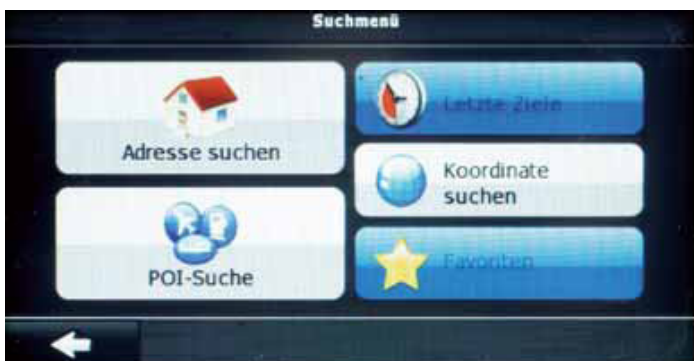
Die Bedienung der Navi ist selbsterklärend