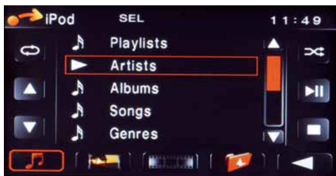
Der Tuner macht seinen Job tadellos

Tests schon hundertfach bewährt. Zenec hat hier beim 524 nicht gespart und alle verfügbaren Features inklusive TMC, 3D-Darstellung, Beschilderungsanzeige und Fahrspurassistent installiert. Das Kartenmaterial deckt 44 Länder aus West- und Osteuropa ab. Die Integration in die Zenec-Hardware ist sehr gut gelungen, Bedienung und Routenberechnung erfolgen flüssig, die Zielführung ist genau und eindeutig. Die gesamten Navigationsdaten sind